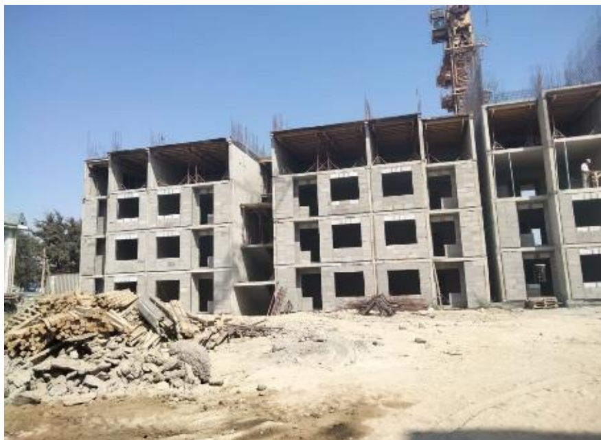
Многоэтажный жилой комплекс «Достар», расположенный по адресу: Алматинская обл., Талгарский р-н, Бесагашский с.о., земли ПК/Без наружных сетей и благоустройства/Пятно-13