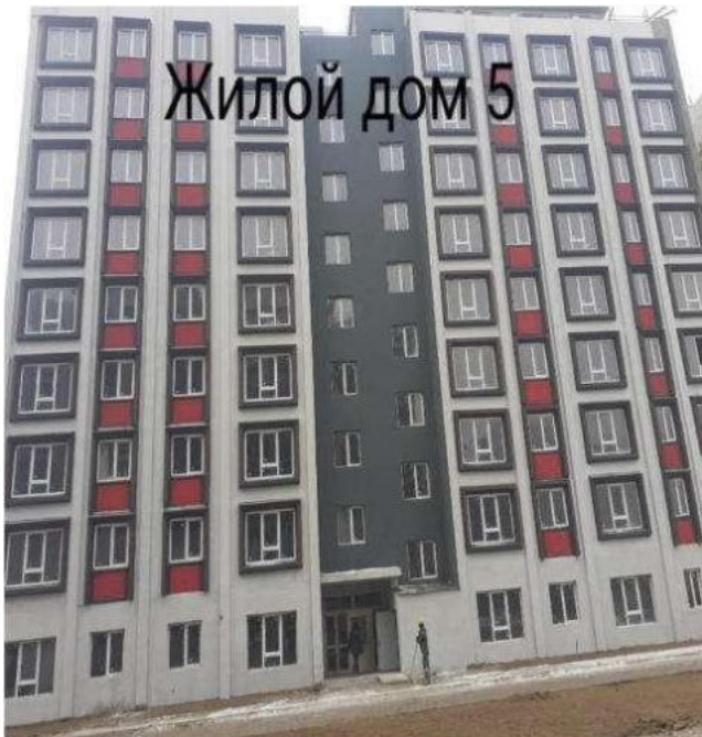
Жилой дом 5