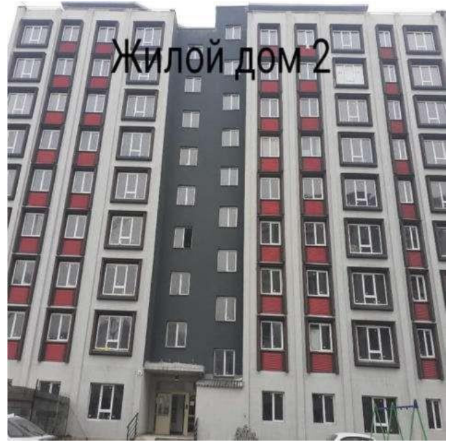
Жилой дом 2