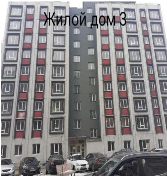
Жилой дом 3