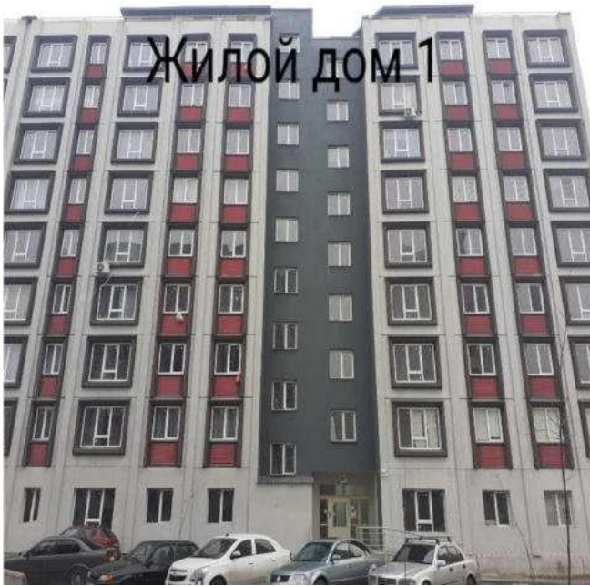
Жилой дом 1