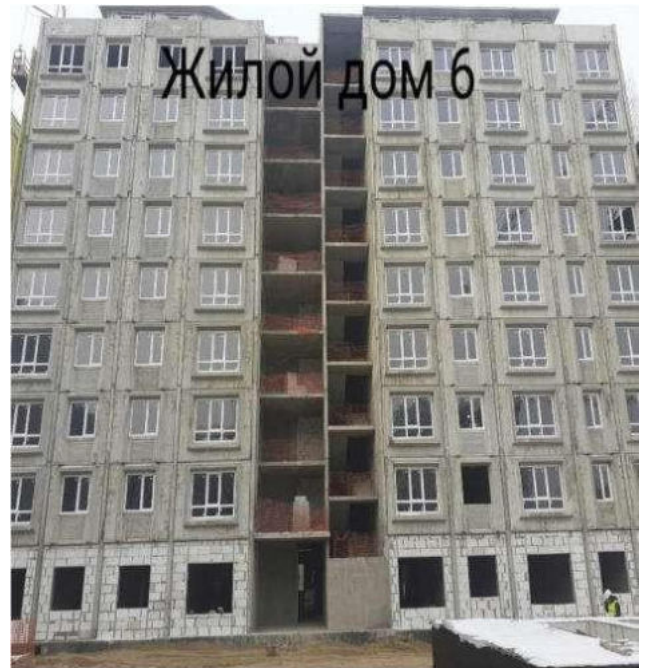
Жилой дом 6