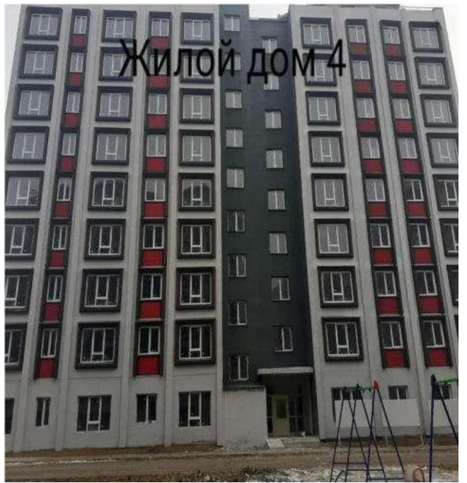
Жилой дом 4