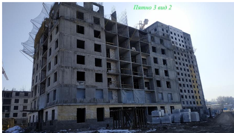
Пятно 3 вид 2