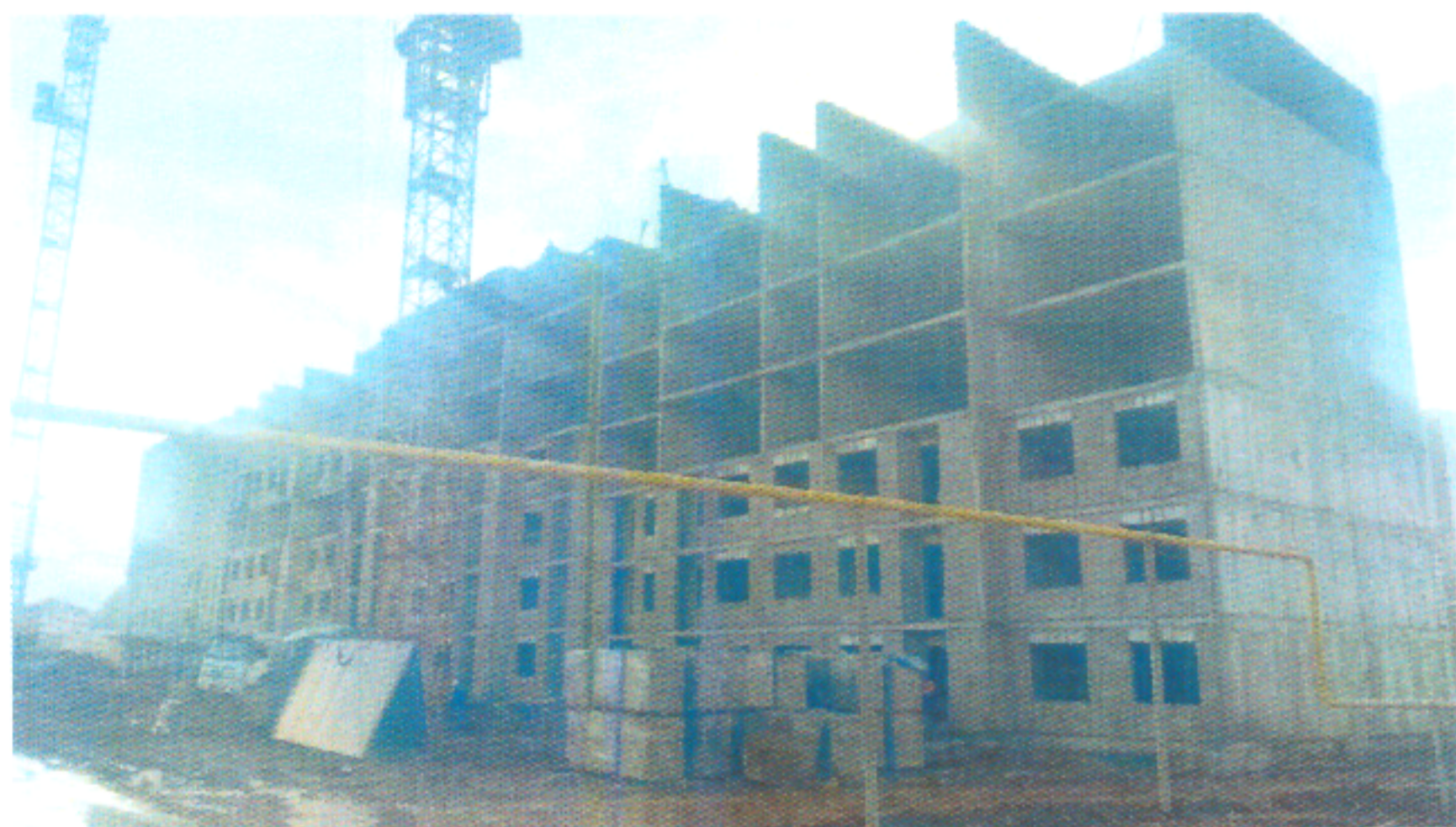
Многоэтажный жилой комплекс «Достар», расположенный по адресу: Алматинская обл., Талгарский р-н, Бесагашский с.о., земли ПК/Без наружных сетей и благоустройства/Пятно-13