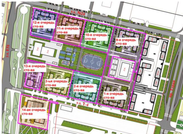
Рис.1 Схема очередности.

Площадка строительства Объекта расположена г.Нур-Султан, район Есиль, пр. Туран, уч. 55/11 «Sezim Qala» - очередь 10 (без наружных инженерных сетей).