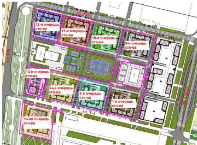
Рис.1 Схема очередности.

Площадка строительства Объекта расположена г.Нур-Султан, район Есиль, пр. Туран, уч. 55/11 «Sezim Qala» - очередь 10 (без наружных инженерных сетей).