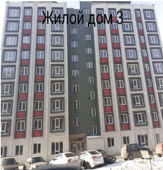
Жилой дом 3