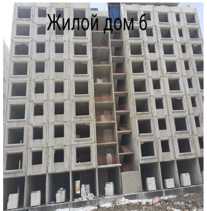
Жилой дом 6