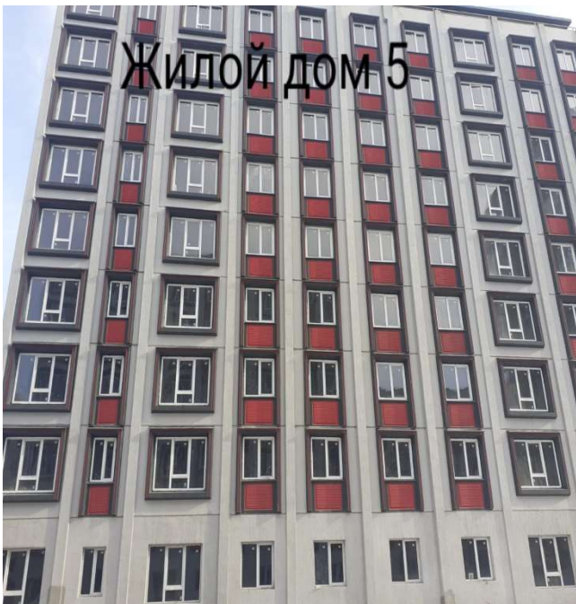
Жилой дом 5