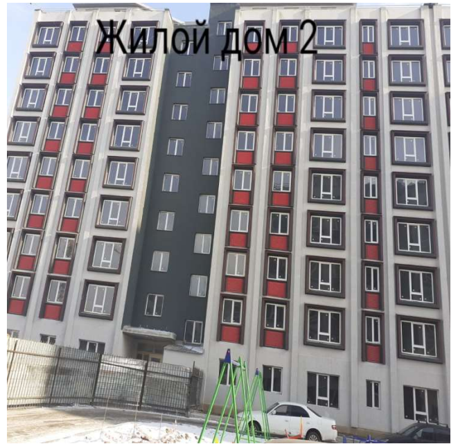
Жилой дом 2