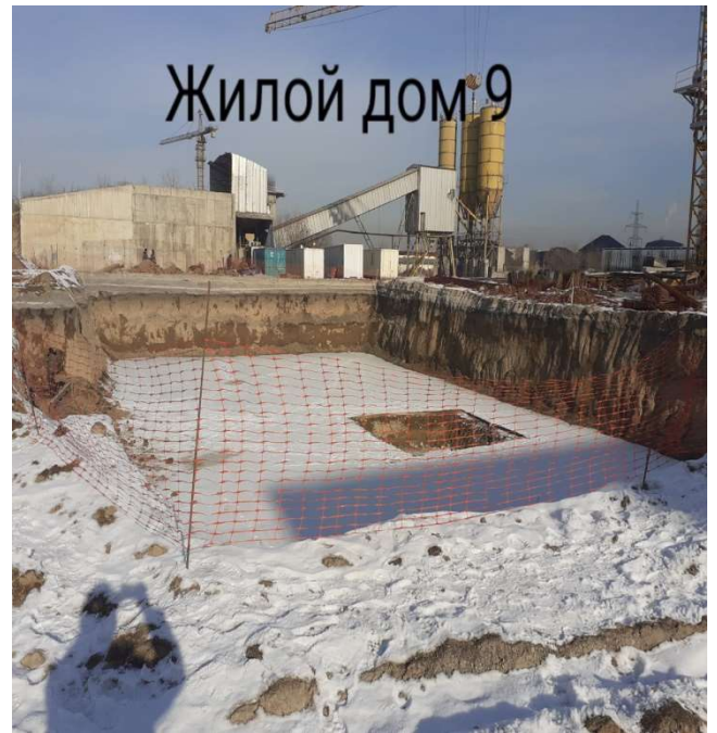
Жилой дом 9