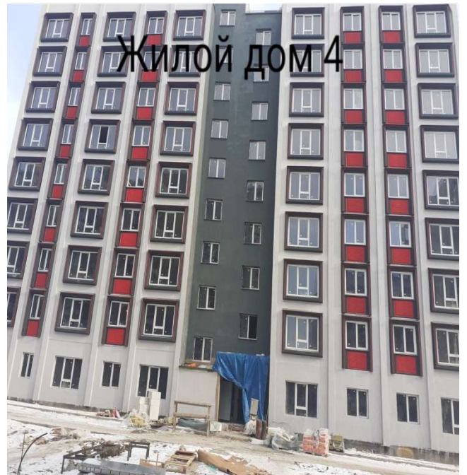
Жилой дом 4