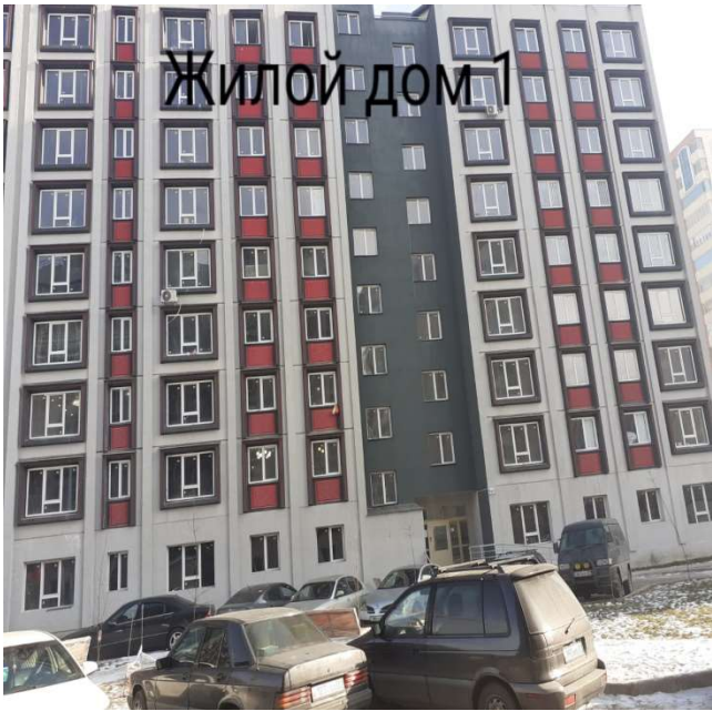
Жилой дом 1