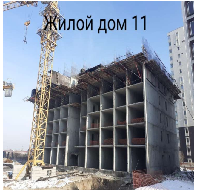
Жилой дом 11