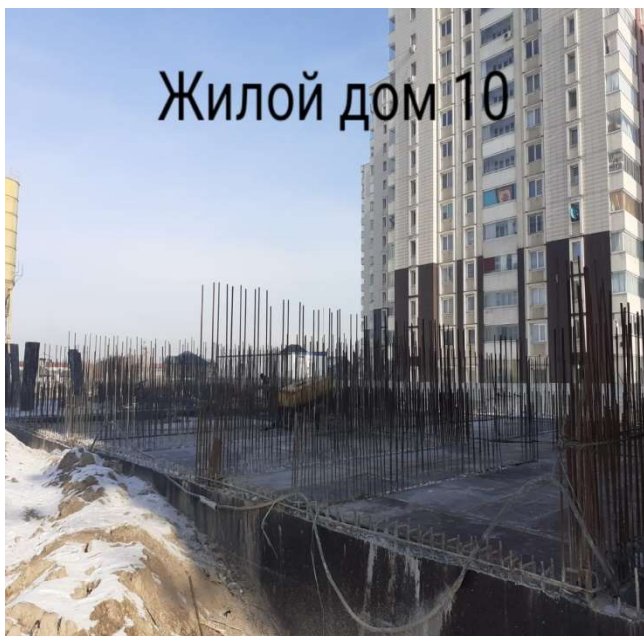
Жилой дом 10