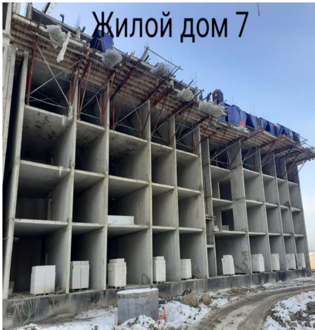
Жилой дом 7